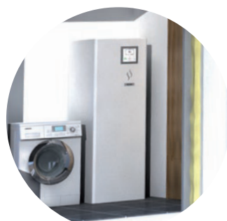
Unité intérieure avec ballon ECS en inox intégré