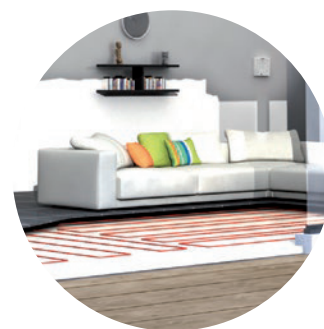
S'adapte aussi bien avec vos radiateurs que vos planchers chauffants